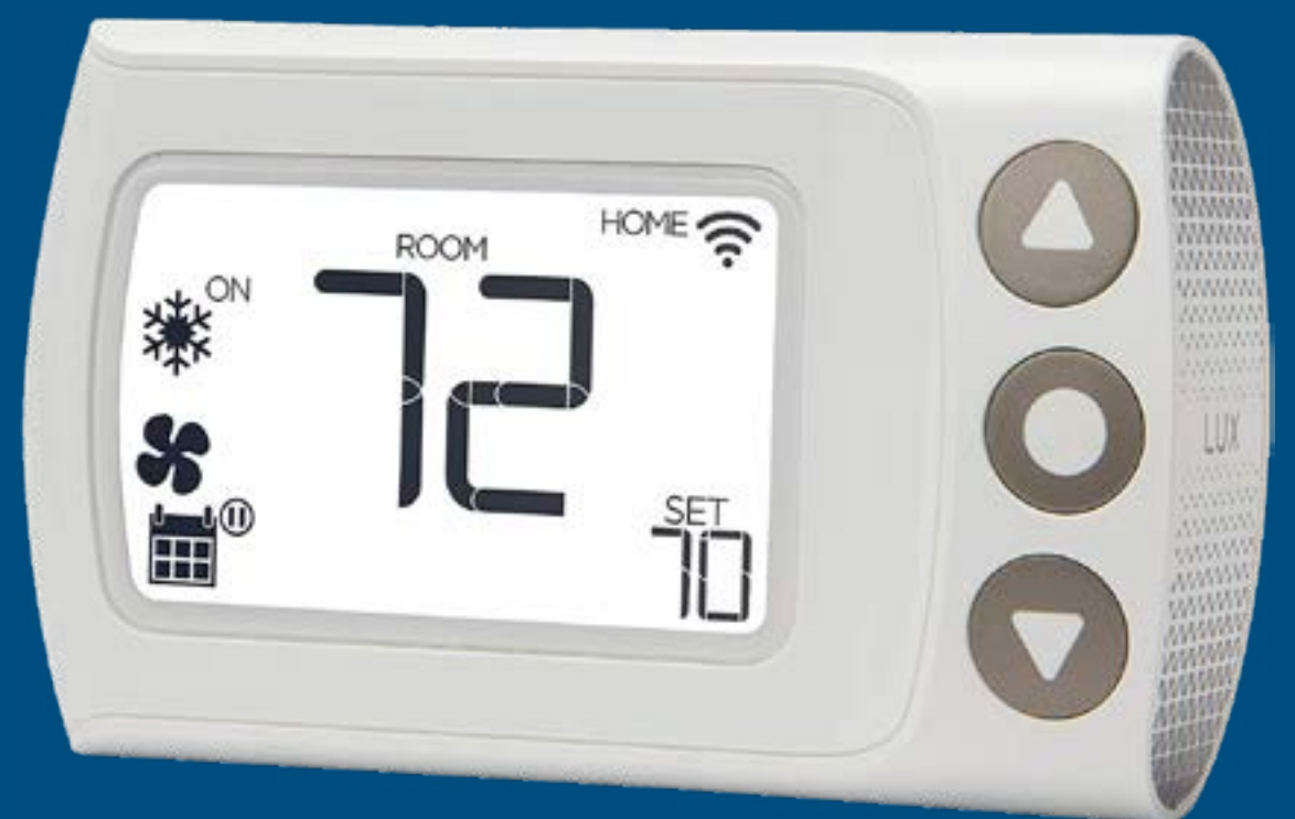
TERMOSTATO LUXPRO DIGITAL CS1 WI FI