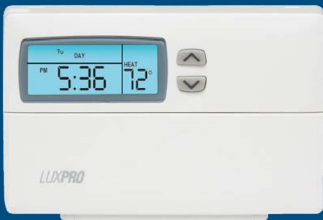
TERMOSTATO LUXPRO 1 ETAPA PROGRAMABLE PSP511LC