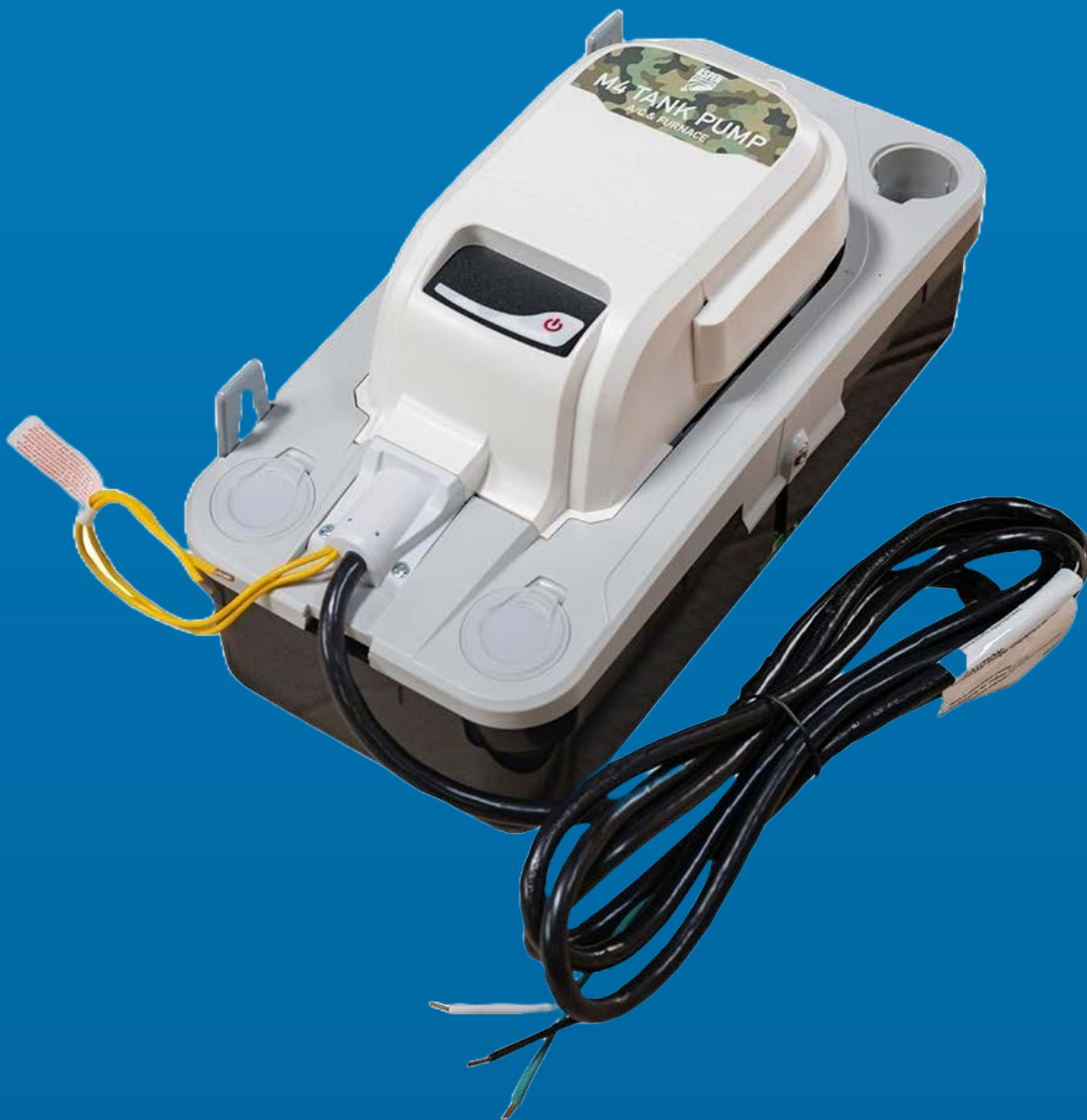
BOMBA DE CONDENSADO ASPEN TANQUE 2LT HI FLOW MAX