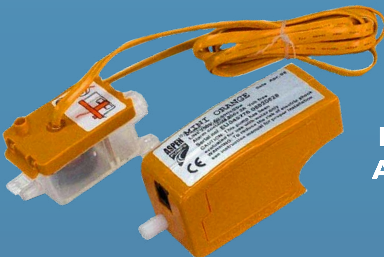
BOMBA DE CONDENSADO ASPEN MINI ORANGE 230V