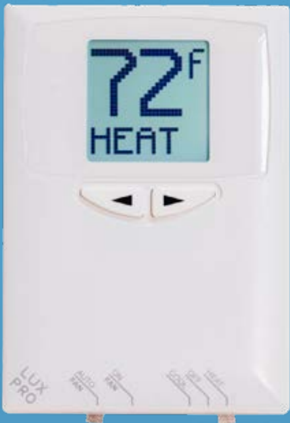
TERMOSTATO LUXPRO 1 ETAPA NO PROGRAMABLE PSD111